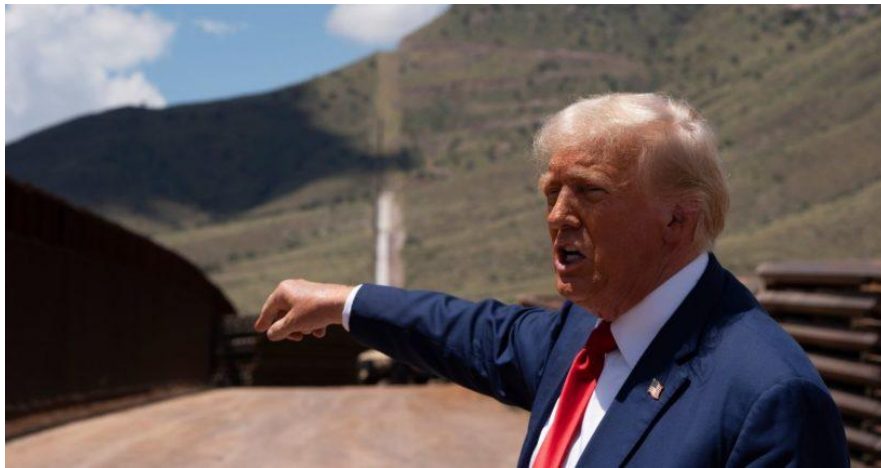
Donald Trump przemawia na granicy USA-Meksyk na południe od Sierra Vista w Arizonie 22 sierpnia.